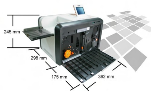
Malé rozměry HiTi P510S

Tiskárna je osazena čtečkou paměťových karet, fotografie z karty vyberete pomocí displeje a odešlete rovnou na tisk. Další možností je přímé propojení fotoaparátu s tiskárnou datovým kabelem. Toto řešení Vám umožňuje odeslat fotografie k tisku ihned po jejich pořízení. Posledním a nejpohodlnějším řešením jak odeslat fotografie na tiskárnu je využít WiFi adaptér, v tomto případě se musí jednat o tiskárnu P510Si, která WiFi komunikaci umožňuje.